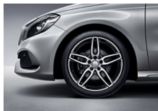
A 200 Sport 225/40 R 18