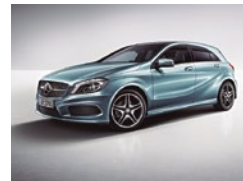
894 Azul Universo