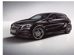
696 Negro Noche