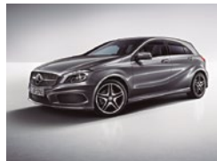
787 Gris Montaña