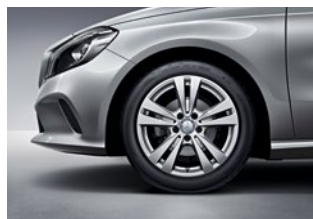
A 200 Urban 225/45 R 17