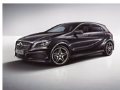
191 Negro Cosmos