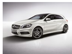
650 Blanco Cirro