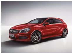
589 Rojo Júpiter