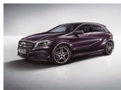
592 Violeta Aurora Boreal