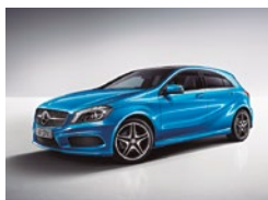
162 Azul Mar del Sur