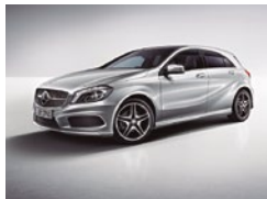
761 Plata Polar